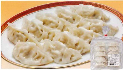
94 肉餃子 20g×10個×2袋セット 小麦 大豆