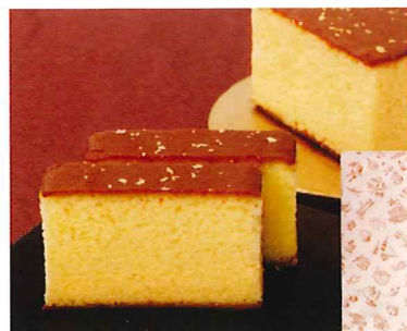
105 金箔入り蜂蜜かすてら 1本 卵 小麦

常温 賞味期間: 180日 形態: 袋入り 厳選された北海道小豆を使ってやわらかく炊き上げた粒あんです。麦芽水飴と有機アガベシロップで仕上げました。パン、ホットケーキ、ヨーグルトなどのトッピングに。