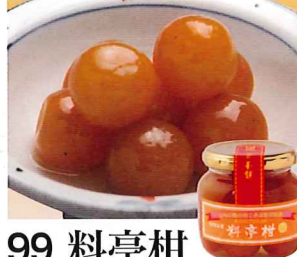
99 料亭柑 230g(固形量:125g)

冷凍 賞味期間: 180日 形態: 袋入り 国内産原料にこだわって作りました。加熱してお召し上がり下さい。薄くスライスして衣をつけて油で揚げてもおいしくお召し上がり頂けます。