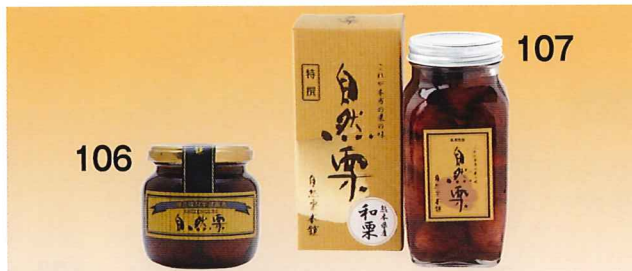
106 自然栗 250g(固形量:125g) 107 自然栗 550g(固形量:300g)

常温 賞味期限: 2023年1月15日 形態: 箱入り 北海道産小麦(きたほなみ)の小麦粉、山形県産鶏卵、国産蜂蜜を使用し、しっとり程よい甘さに焼き上げました。金箔を添えた華やかなカステラです。