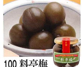
100 料亭梅 240g(固形量:135g)

常温 賞味期間: 720日 形態: ペン入り 宮崎県で栽培された寧波金柑を使用。ひとつひとつ丁寧に金柑の種を取りじっくりと炊き上げています。シロップとともに湯で割り「金柑湯」にするのもおすすめです。