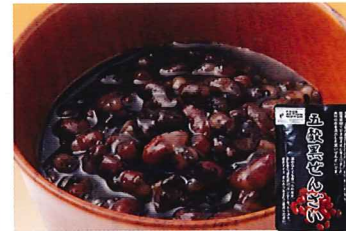
103 五穀黒ぜんざい 180g

冷凍 賞味期間: 180日 形態: 袋入り もちもちした食感に有機くるみのカリッとした歯ごたえが楽しい胡桃羊羹です。