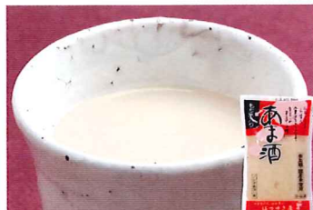
101 あま酒 300g

常温 賞味期間: 720日 形態: ペン入り 和歌山県産白加賀梅を砂糖だけで丁寧に炊き上げました。白加賀は肉厚で繊維が少ないのが特長です。