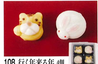
108 行く年来る年 4個

常温 賞味期間: 720日 形態: ペン入り 古くから味が良い事で有名な熊本産の和栗を使用。皮は薬品を使用せずに剥き、栗本来の風味を活かす為に薄皮を残して国内産でんさい糖だけで炊き上げました。しつこくない程良い甘さです。