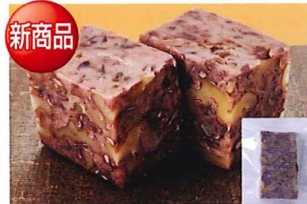
102 胡桃羊羹 2本 小麦

常温 賞味期間: 120日 形態: スタンド袋入り 国内産のうるち米ともち米を原料とし、麴の力だけで糖化させた、あっさりした甘みの昔ながらの人気の甘酒です。砂糖は使用しておりません。