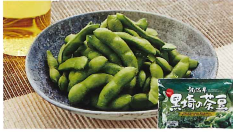
95 冷凍新潟黒崎の茶豆 230g 大豆

冷凍 賞味期間: 240日 形態: トレイ袋入り 国産豚肉・キャベツ・玉ねぎ・ニラを醤油・胡麻油・ニンニク・いり胡麻などの調味料で味付けし国内産小麦粉で作った皮で包みました。焼いて、パリッとした皮と、コクのあるジューシーな具材をお召し上がり下さい。