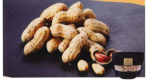
96 千葉産半立ち殻付き落花生 150g 落花生

冷凍 賞味期間: 540日 形態: 袋入り 新潟市の西に位置した旧黒埼地区(現新潟市西区)の肥沃な土壌で、丹精込めて育てられた茶豆です。早朝に収穫された茶豆を、素早く冷凍加工し採れたての美味しさを、そのまま袋詰めしました。