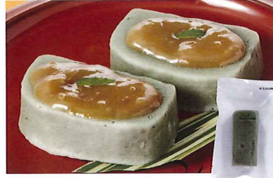
98 よもぎ麩 125g 小麦

冷凍 賞味期間: 180日 形態: 袋入り 国内産原料にこだわって作りました。煮物や、焼いて田楽などにお召し上がり下さい。お鍋に入れるときは煮すぎないようにして下さい。