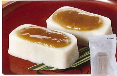
97 なま麩 125g 小麦

常温 賞味期間: 90日 形態: 袋入り 千葉県産の落花生です。中でも一番甘みが強く最高級品種と言われる千葉半立ち種を使用しています。