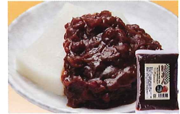
104 北海道産小豆使用粒あん 350g

常温 賞味期間: 540日 形態: 袋入り 北海道産小豆、福井県産大麦、静岡県産黒米と赤米、国産の炒り黒ごまを、種子島産粗糖で甘さ控えめに煮上げました。素材の色を活かした黒いぜんざいです。お好みでお餅等と一緒に。